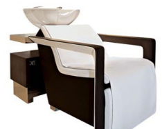
Voorbeeld bestelde wasunit

Deze zomer is Jitty s al weer 9 jaar open. Dit jaar hebben we met een team van mensen waaronder interieur-architecten en andere salon-eigenaren het interieur van Jitty s eens goed onder de loep genomen. We zijn tot de conclusie gekomen dat het goed was om een aantal punten te verbeteren. Het belangrijkste verbeterpunt zien wij in de was-units. We hebben twee nieuwe units besteld van zeer hoge kwaliteit met ingebouwde shiatsu massage. Verder zullen we enkele kleine verbeteringen doorvoeren in de look & feel van ons interieur. Alle verbouwingen zullen in het weekend plaatsvinden waardoor er weinig overlast voor onze klanten zal zijn. Vanaf eind augustus kunt u genieten van onze nieuwe zeer luxe was-units en aangepast interieur.